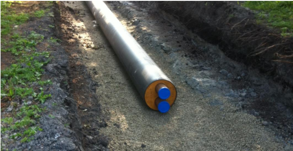
Ett twin fjernvarmerør i stål med plastkappe.